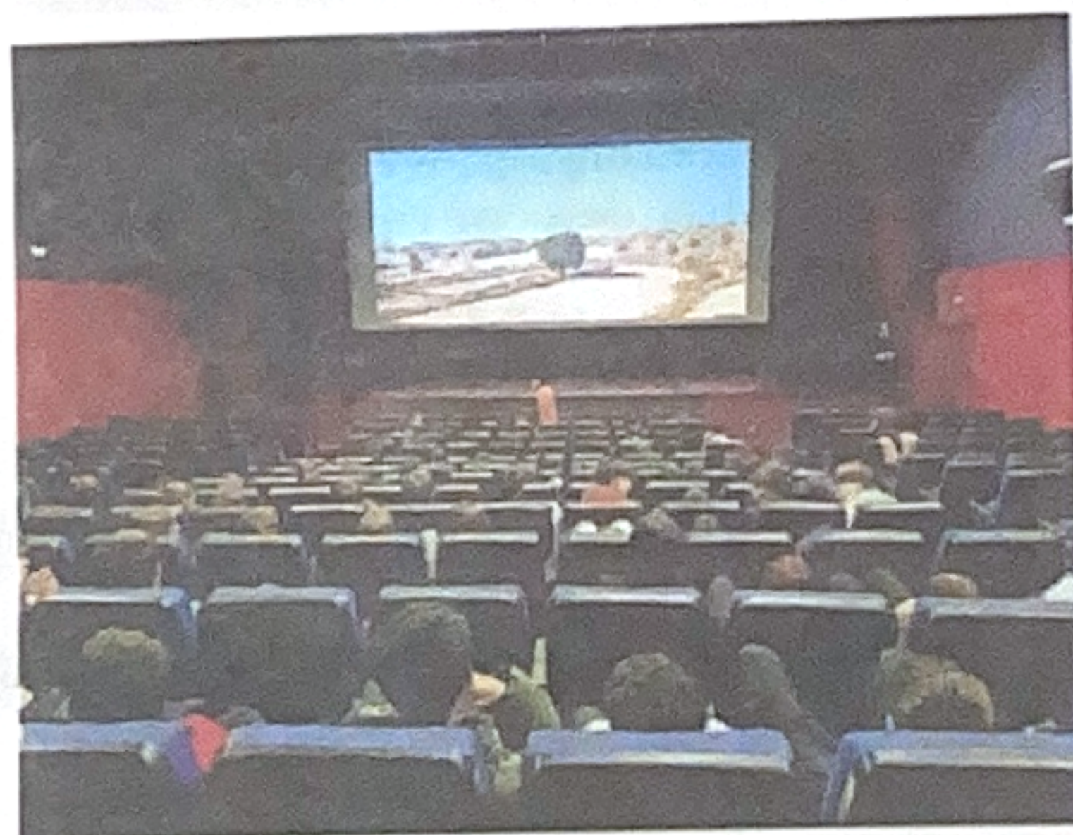
Repaso a los audiovisuales más destacados.