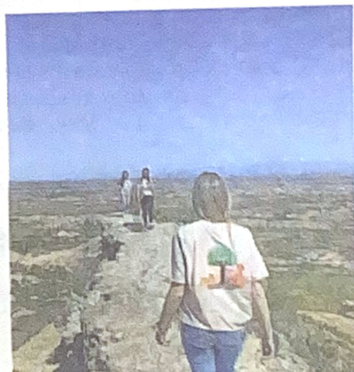
Ruta por Jubierre y proyecto de camisetas. IES M. GASPAR LAX