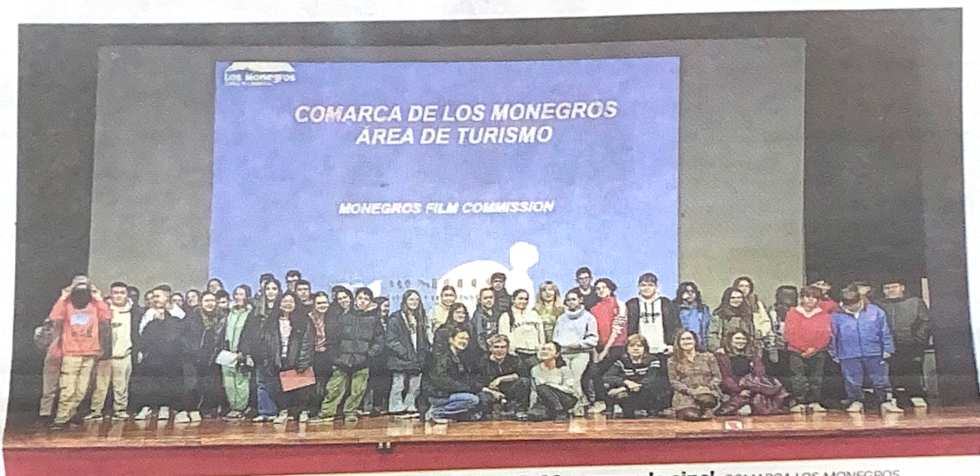
Alumnado del IES Monegros Gaspar Lax, en la actividad 'Un Monegros de cine'. COMARCA LOS MONEGROS

Las actividades de 'Entorno comarcal' se incorporan al horario lectivo del IES Monegros Gaspar Lax y giran en torno a tres ejes: las visitas a lugares de interés de la